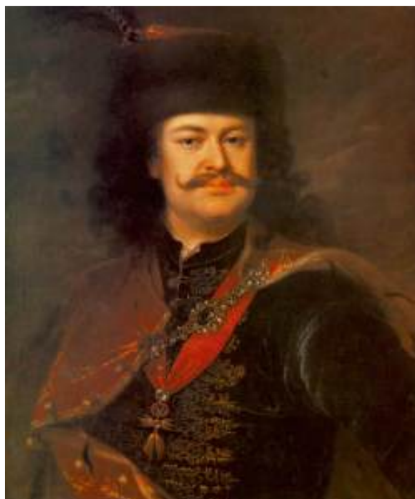
František Rákóczi II.

Rok 2006 bol v Maďarsku Rokom Rákócziho - práve vlni uplynulo 330 rokov od narodenia (1776) a 100 rokov od prenesenia pozostatkov tohto uhorského národného hrdinu z ďalekého Turecka na rodnú hruď (1906). Paradoxom historického vývoja, ktorý nastal po skončení 1. svetovej vojny v Európe je to, že obe najvýznamnejšie miesta spojené so životnou púťou Františka Rákócziho II. sa ocitli na území Slovenska. Narodil sa v kaštieli v Borši neďaleko Stredy nad Bodrogom a pochovaný je v krypte Dómu svätej Alžbety v Košiciach.