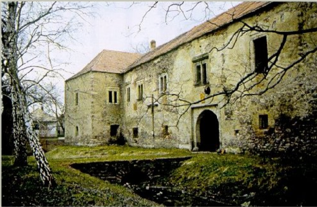
Kaštieľ v Borši, rodisko Františka Rákócziho