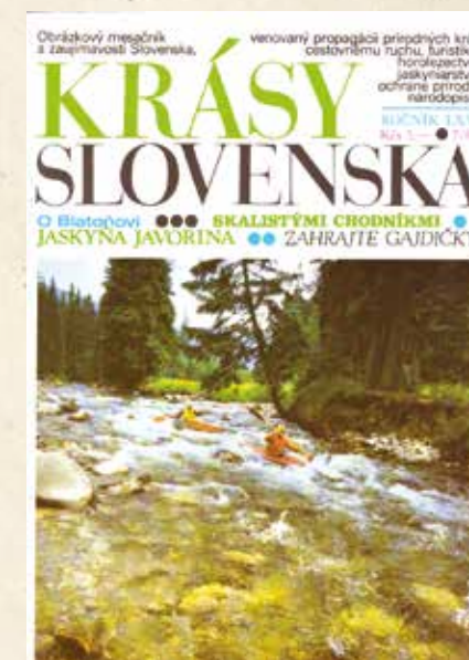
▲ Splav Belej na titulnej strane (KS 7/1988)

zaoberať sekcia cykloturistiky vtedajšieho Zväzu turistiky SÚV ČSZTV. Oblubu rýchlo získali cykloturistické podujatia – či už Okolo Tatier, organizované už od roku 1968, ale aj novšie – Tri hrady Zemplína (od 1977), Okolo Liptova (od 1979) a Okolo Čergova (od 1981). Zo všetkých uverejňovali Krásy Slovenska aktuálne informácie. Podľa vzoru pešej, lyžiarskej a vysokohorskej turistiky rozbehla aj sekcia cykloturistiky svoje každoročné hlavné podujatia vo forme slovenských zrazov cykloturistov. Prvý ročník sa uskutočnil v roku 1978 v Stráži pri Komárne. V nasledujúcich rokoch sa už konali pravidelne, s výnimkou roku 1985, keď sa slovenskí cykloturisti zúčastnili na Československej spartakiáde v Prahe. Tradícia sa udržala do súčasnosti a v roku 2020 sa vo Vrútkach uskutočnil už jeho 42. ročník. Adekvátne s rastúcou popularitou cykloturistiky dostávajú na stránkach KS patričný priestor aj reportáže z týchto podujatí.