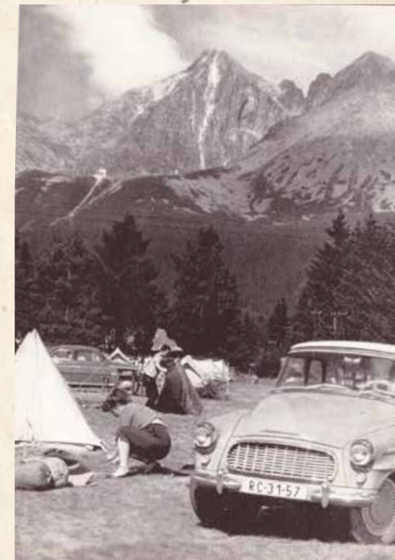
▲ Autokemping v Tatrách (KS 7/1961)

Na systematické a metodicky usmerňované celoplošné vedenie si turistika mládeže musela počkať ďalšie dve desaťročia. V rámci Zväzu turistiky ČSZ-TV rýchlo pribúdali turistické oddiely mládeže (TOM) a ich členovia dostali