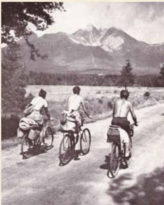
▲ Pod Lomnickým štítom (KS 5/1954)

Velikonoční plavba Oravou, Hron, Vodák objavuje nové sportovné vody, ale ohlasovali sa už i zástupcovia slovenských vodáckych oddielov, ktoré splavovali Hornád, Váh z Liptovského Hrádku do Považskej Bystrice či predkladali úvahy, ako oživiť vodnú turistiku na Slovensku. Popisovali už aj prvé zápočtové cesty po Dunaji.