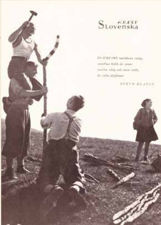
▲ Značkovanie na Tlstej, foto: Emil Scheer (KS 6/1954)

československých turistov 51 objektov ako majetok ústredia alebo odborov, ďalšie mal v prenájme.