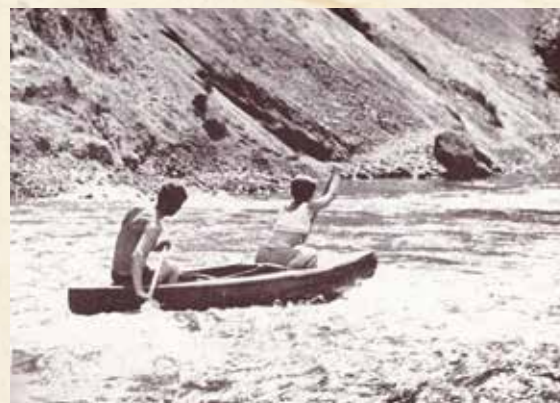
◀ ▼ Na vlnách Oravy