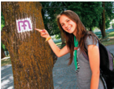
▲ Značka na Stredoeurópskej mariánskej ceste

Koncom mája predstavitelia KST, MUTKE (maďarská organizácia Mária Út Közhasznú Egyesület) a VM (Via Mariae, o. z.) podpísali trojstrannú dohodu o budúcej spolupráci pri vytýčení a vyznačení Stredoeurópskej mariánskej cesty na území Slovenska.