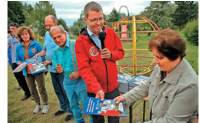
▲ Z krstu publikácie Arnošta Guldana Pohľad do dejín značenia turistických chodníkov na území Slovenska