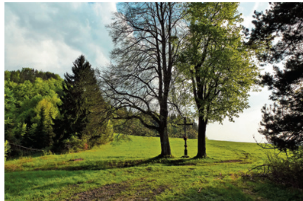
▲ Sedlo Marek v Súľovských vrchoch