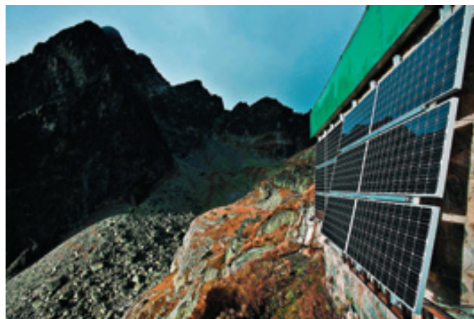
▲ Fotovoltaika na Téryho chate

* Malé vodné elektrárne sú závislé od prítoku vody turbínou. V prípade dlhotrvajúcich mrazov alebo sucha nie je možné zabezpečiť výrobu pomocou obnoviteľného zdroja a pre prevádzku chaty je nevyhnutné dočasne spustiť dieselagregát.