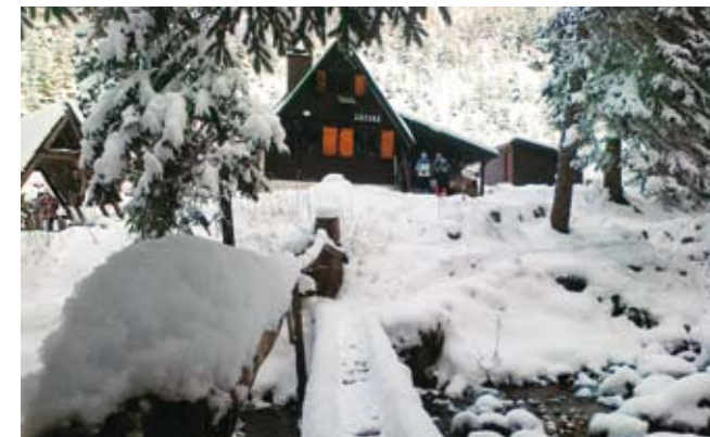
▲ Chata v Látanej doline

10. novembra štvorčlenná výprava VV KST mototuristicky navštívila vojenský pamätník na Dukle. Potom nasledoval presun do Stropkova, odkiaľ vyrážala hlavná skupina 24. hviezdového výstupu na Baňu (526 m) s cieľom pri chate KST Slávia Stropkov, ktorú v roku 2010 svojpomocne vybudovali miestni turisti.